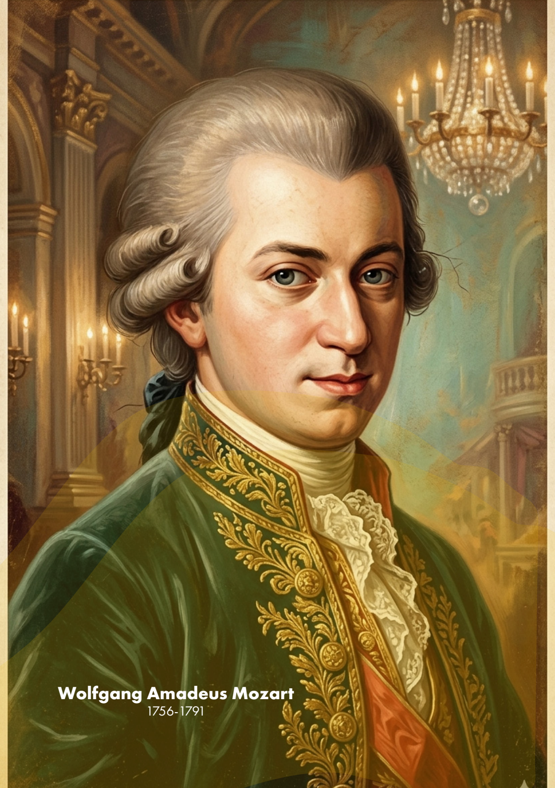
Wolfgang Amadeus Mozart 1756-1791